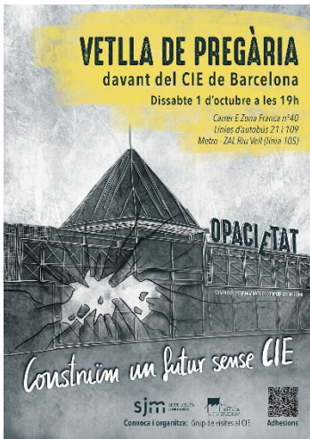
Dissabte 1 d'octubre, 18 h. Vetlla de pregària CIE