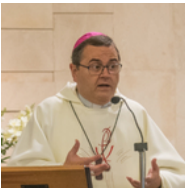
Sergi Gordo , el bisbe de la Pastoral Obrera

https://pastoralobreracat.acmbtrc.com/envio/ver/1860582/P7NONCoq1Qi0ux6yEuAJPZdQXX8oK31MJGt/c996a13ca0657b32d547db9d4211ef8c/