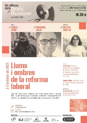
Dilluns, 3 d'octubre, 18,30 h. LLums i ombres de la reforma laboral