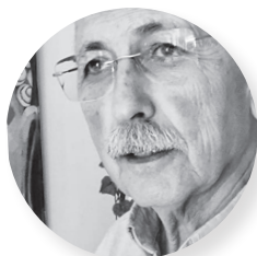
José Luis Vázquez Borau Autor