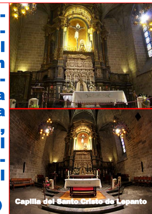
Capilla del Santo Cristo de Lepanto

( https://esglesia.barcelona/es/en-directo/ )